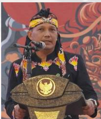
Kepala Dinas Kebudayaan dan Pariwisata Kota Blitar