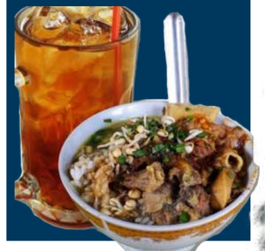
Soto Bok Ireng